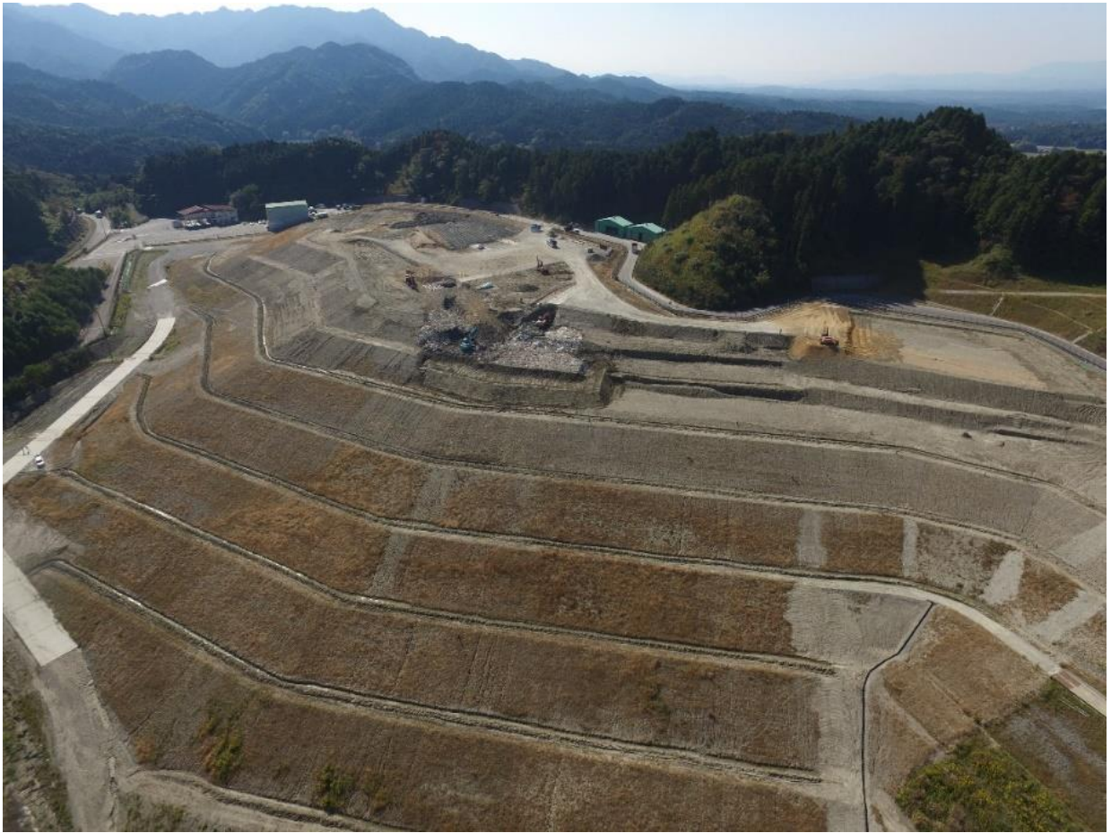
(ドローン R5.11.1 撮影)