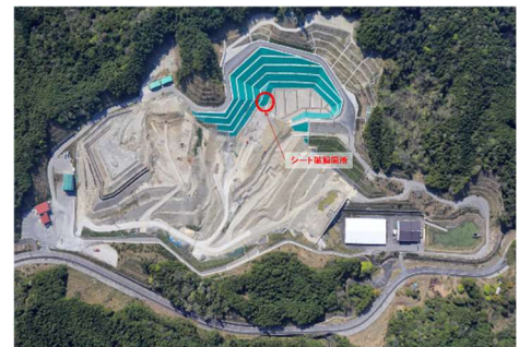
図1 損傷箇所 :○