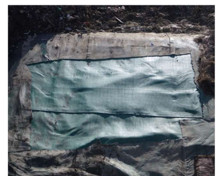
上層の保護シート修理 溶着完了 撮影日:10月26日