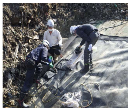
下層の遮水シート修理 負圧検査 問題なし 撮影日:10月26日