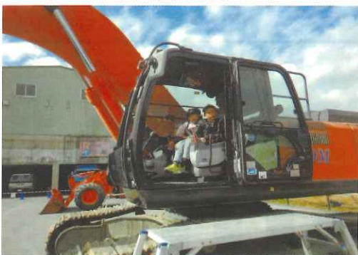
建設機械に乗って写真撮影