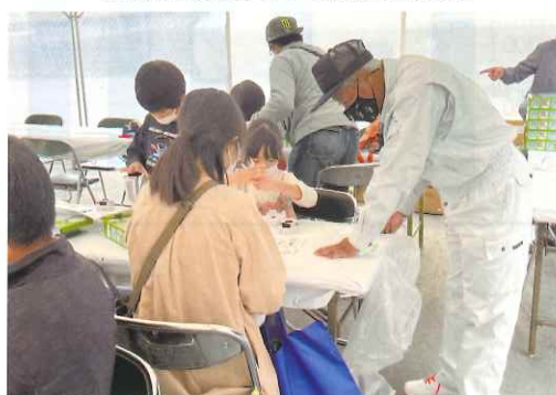
ペットボトルでライト作り