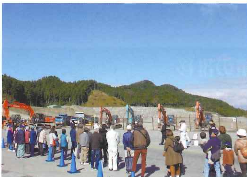
青空の下で開会式