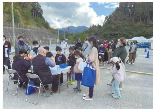
ロケットの打ち上げは行列ができました