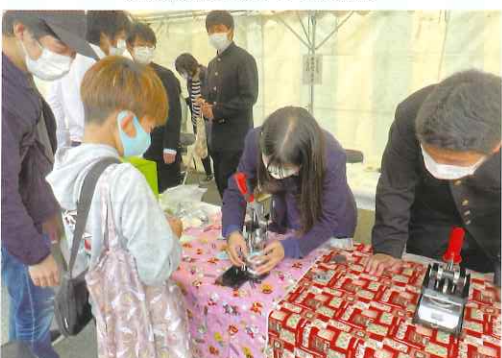
缶バッジコーナーも大人気