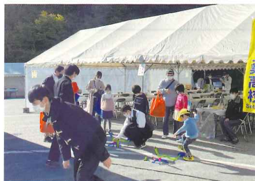
足踏み式のロケットも飛ばしました