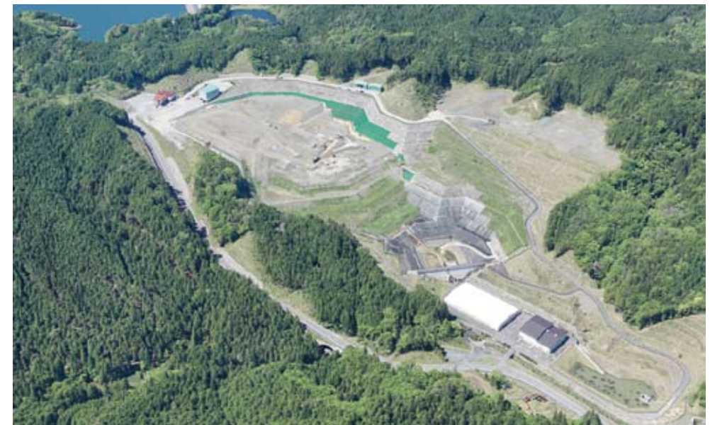
2016年5月12日現在 クリーンセンター滋賀埋立状況

*「環境監視委員会開催の概要」は公益財団法人滋賀県環境事業公社ホームページに掲載しています。