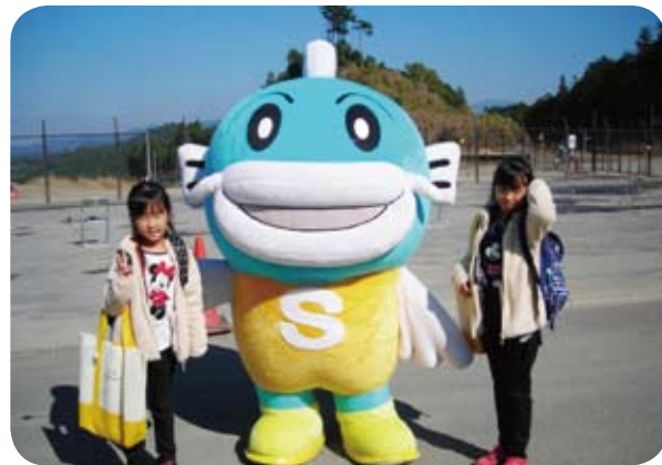
キャッフィーといっしょ