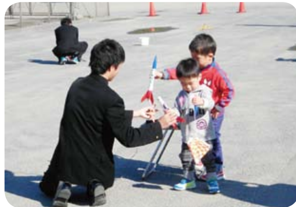
モデルロケット打ち上げ

当日は、地元の方には炊き込みごはんと豚汁をご用意いただき、モデルロケットの制作と打ち上げ、電気自動車体験、似顔絵コーナー、施設見学とエコクイズなどの催しのほか、成安造形大学の学生さんがデザインしたアクセサリーや地元特性の味噌・野菜の販売なども行い、たいへん楽しいイベントになりました。