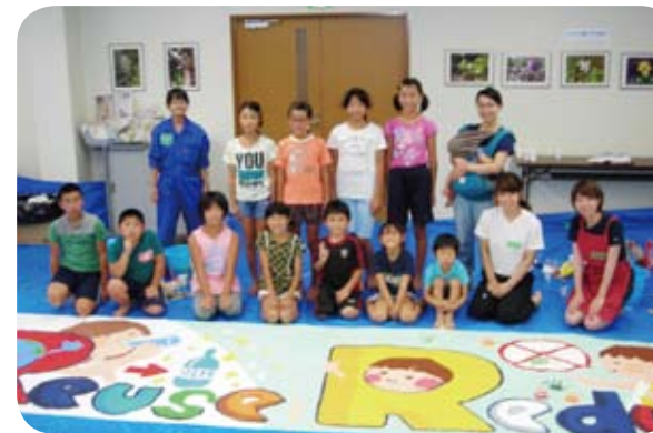
参加した小学生たち

完成した壁画は、「滋賀クリーンセンター滋賀」の施設内にある事務所の壁に掲げていますのでいつでもご覧いただけます。