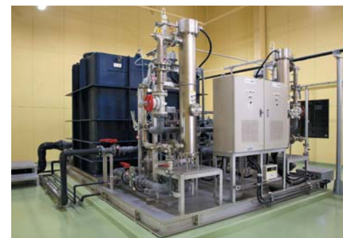
ダイオキシン処理装置